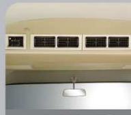
AC DOUBLE BLOWER*