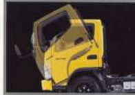
Kabin Jangkrit Mudah memeriksa dan memperbaiki mesin.