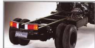
Chassis Semakin Kokoh dan Tangguh Chassis diperlebar, semakin kuat, stabil dan utur panjang.

Mitsubishi Fuso Colt Diesel HD kini tampil semakin gagah dengan desain eksterior kabin dan fitur-fitur terbaru. Dilengkapi dengan mesin tipe 4D34 yang telah terbukti dan dipercaya membuat Mitsubishi Fuso Colt Diesel semakin bertenaga, semakin tak tertandingi ketangguhannya dan keandalannya dengan penambahan Turbocharger, Intercooler, dan New Injection Pump. Kenyamanannya kian sempurna berkat konsep baru untuk kendaraan niaga, perubahan total pada desain interior kabin yang memiliki ukuran paling luas di kelasnya dan peningkatan fungsi serta ditunjang perlengkapan standar untuk pengemudi. Siapapun akan merasa semakin aman ketika mengendalikannya karena truk ini dilengkapi fitur-fitur keamanan aktif dan pasif yang lebih maju dan modern.