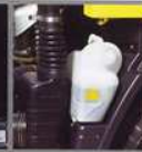
Tangki radiator Mudah dikontrol