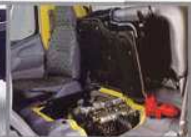
Inspection Lid Berada di bawah jok penumpang sehingga pengecekan mesin lebih mudah.