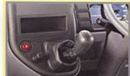
Mitsubishi In Dash Gear Shift (MIS) Tua transmisi menyatu dengan dashboard, kabin lebih lega.