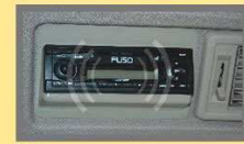
Tape Dilengkapi tape yang menambah kenyamanan berkendara.