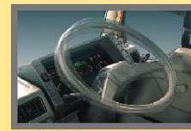
Power Steering Dengan fasilitas power steering, pengendalian kemudi semakin mudah dan nyaman.