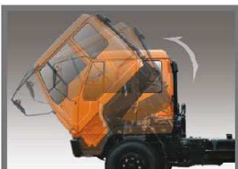
Kabin Jangkak Mudah memeriksa dan memperbaiki mesin