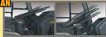
Tilt & Telescopc Steering Posisi dapat diatur dengan sudut kemiringan terendah (jauh-dak-dan tinggi-rendah) sesuai postur tubuh pengemudi.