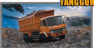
Tangguh dan terkuat tangguh dalam menaklukkan medan-medan sulit dan berat.