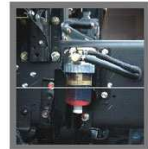
Water Separator Mudah dicik.