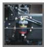
Water Separator. Menjaga oli.