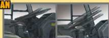
Ti & Torsi. Ruang. Ruangmu lebih luas dengan sudut pandang terbaik. Jadi lebih mudah mengemudi dan lebih nyaman.