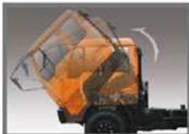
Kabin Angin. Membuatmu lebih nyaman saat mengemudi.

Berat transmisi FN 527 ML. Mengurangi beban tenaga yang diperlukan saat beroperasi dengan 5 tngg di berbagai daya tarikan, mampu & akurasi transmisi yang semakin stabil.